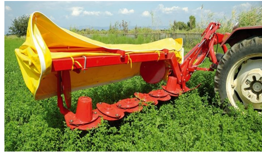
Guadañadora rotativa de discos