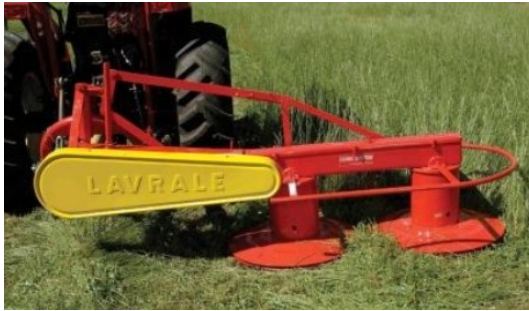
Guadañadora rotativa de tambores